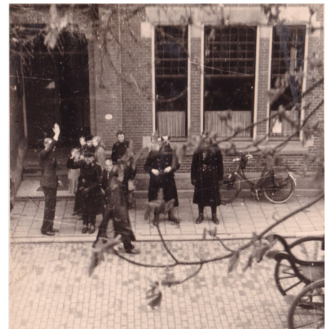
bezoek Mussert aan Gemeentehuis